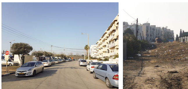
עיקרי הממצאים וההמלצות

בסמוך למתחם השוק נמצאים רחוב הרצל, צפונית לשוק, ורחוב זלמן שזר ממזרח לו. על פי ההסכם שהיה אמור להחתם בין העירייה לבין בעלי הדוכנים, פעילות השוק אמורה להתחיל בשעה 6.00 בבוקר. בפועל, הרוכלים מגיעים בשעות הבוקר המוקדמות טרם הפעלת הדוכנים על מנת לבנות אותם, מקימים רעש ובכך מפריים את שלוותם של תושבי הרחובות הסמוכים (עבירה על חוק העזר העירוני לעיל, פרק ד'). כמו כן, בסיום פעילות השוק בשעות הערב נמצא כי חלק מאשפת השוק מתפזרת ומגיעה למתחם שליד האצטדיון העירוני.